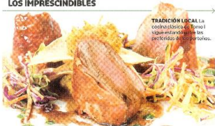
TRADICIÓN LOCAL La cocina clásica de Tomo I sigue estando entre las preferidas de los porteños.